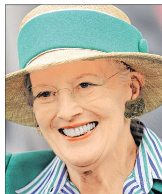
Königin Margrethe empfing Andreas Mogensen auf Schloss Amalienborg.

mark so begeistert verfolgt wurde wie einst in der Welt die Landung der ersten Menschen auf dem Mond, erlebte nach seiner Rückkehr aus der Weite des Raumes ins kleine Dänemark eine Überraschung: Königin Margrethe empfing ihn auf Schloss Amalienborg und zeigte sich sowohl gut informiert als auch interessiert an Mogensens Erlebnissen und Experimenten während des zehntägigen Aufenthalts in der ISS. Und sie entließ den Astronauten mit einem goldenen Schmuckstück, nur ganz selten außerhalb der königlichen Familie verliehenen Or-